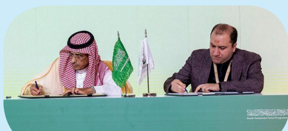
المؤتمر الدولي للتوائم المتصلة

قال خادم الحرمين الشريفين الملك سلمان بن عبدالعزيز آل سعود، إن انعقاد مؤتمر التوائم المتصلة، جاء بمناسبة مرور أكثر من ٣٠ عاماً على بدء البرنامج السعودي الوطني للتوائم المتصلة، الذي تلاقت فيه إنسانية الطب مع إرث المملكة، المستمد من ديننا الإسلامي الحنيف. وأضاف: تواجه حالات التوائم المتصلة تحديات معقدة، بما في ذلك ندرتها، حيث يُقدّر معدل حدوثها بنحو ١ لكل ٥٠ ألف ولادة؛ ممّا يتطلب تكريس الجهود العلمية والطبية لتجاوز تلك التحديات، وتكثيف المساعي الإقليمية والدولية بما يكفل تذليل الصعاب في هذا المجال، وتوفير الدعم والرعاية اللازمين لهذه الحالات. جاء ذلك في كلمة خادم الحرمين الشريفين، التي ألهاها نيابة عنه أسس، صاحب السمو الملكي الأمير فيصل بن بندر بن عبدالعزيز أمير منطقة الرياض، في افتتاح فعاليات المؤتمر الدولي للتوائم المتصلة، الذي ينظمه مركز الملك سلمان للإغاثة والأعمال الإنسانية، بالشراكة مع الأمم المتحدة، ومنظّماتها الإنسانية في مدينة الرياض، ويستمر يومين. وأثمر ذلك عن تقديم نموذج متميز في الرعاية الطبية، جسده البرنامج السعودي الوطني للتوائم المتصلة، وتمثل في رعاية ١٤٣ حالة من ٢٦ دولة، وإجراء ٦١ عملية فصل ناجحة؛ وكان في استقبال سموه لدى وصوله مقر الحفل المشرف العام