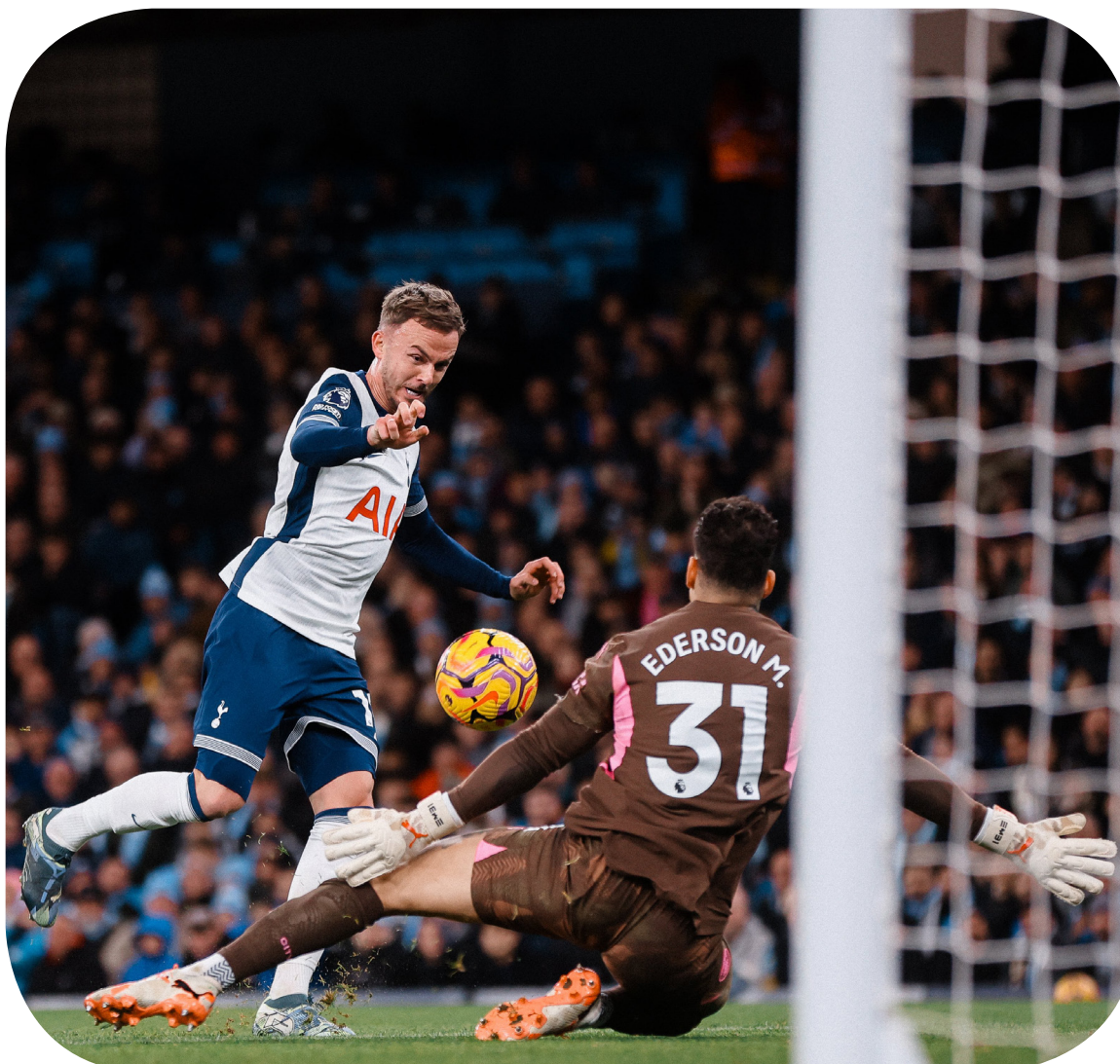
من مباراة السيتي وتوتنهام السبت الماضي

ولا يملك مانشستر سيتي ما يكفي من وقت ليلعب جراحه، إذ يستضيف فينورد في دوري أبطال أوروبا يوم الثلاثاء، ثم يتوجه إلى أنفيلد بعدها به أيام لمواجهة ليفربول. وقال غوارديولا: «نشعر بالسعادة عندما نفوز، وبالحنن عندما لا نفعل. هذا أمر طبيعي. وكانت ثمة مشكلة إذا لم نفعل ذلك. لسنا معتادين على هذا الوضع ولكن هذه هي الحياة. يحدث هذا في بعض الأحيان وعلينا أن نقبله. هذا هو الوضع الآن، وستعافى ونغيّر الأمر».