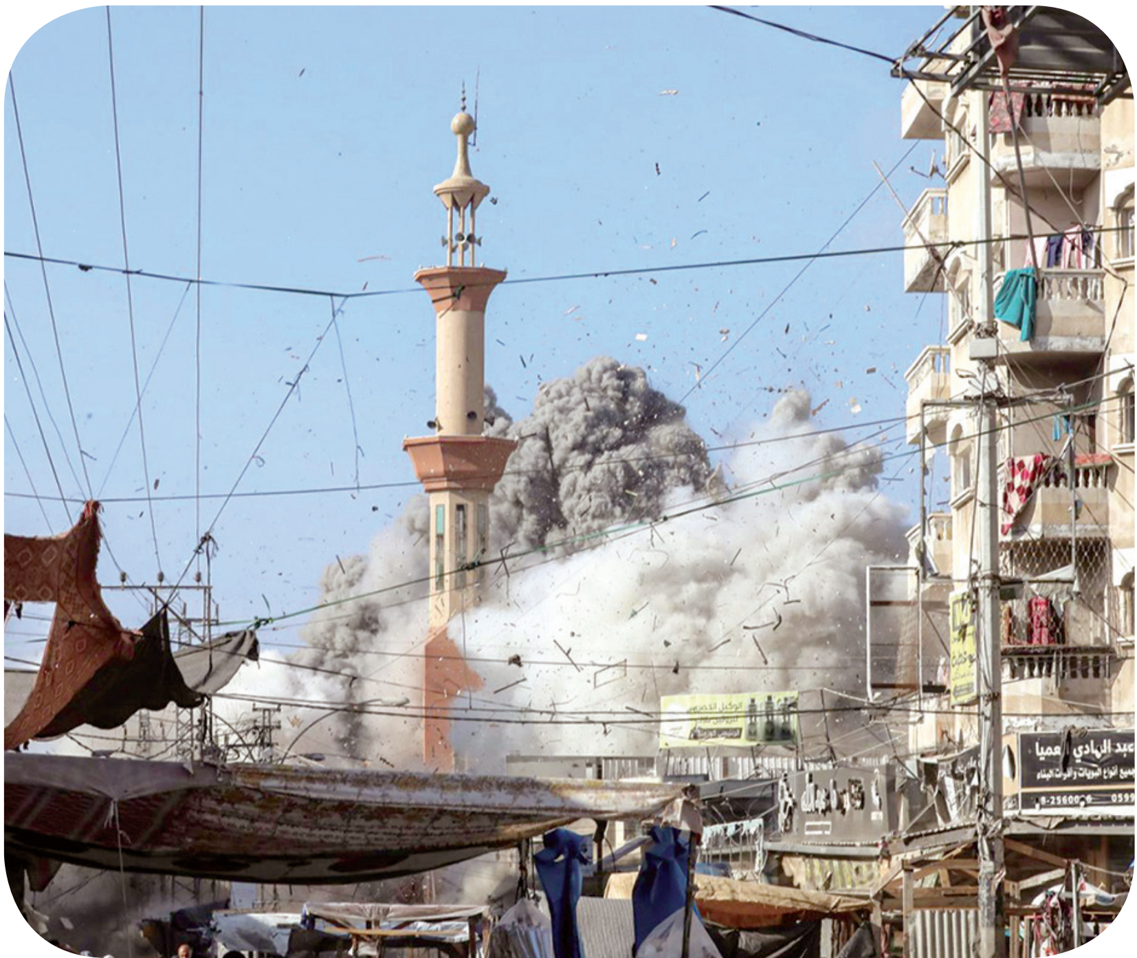
القاهرة - غزة - بيروت - متابعات

نقلت وسائل إعلام غربية، أمس، عن جنود احتياط إسرائيليون بالخدمة، عدم تخيلهم أبداً أن تستمر الحرب على قطاع غزة هذه المدة الطويلة.. وأوضحت أن جنود احتياط إسرائيليين بالخدمة أن صبرهم ينقذ ويشعرون بالإرهاق مع تزايد عدد القتلى وتوسع نطاق القتال في الجنوب اللبناني، كما أن أعداداً متزايدة من جنود الاحتياط الإسرائيليين يختارون عدم الحضور للخدمة العسكرية في الجيش. وأشارت إلى أن المجتمع الحريدي المتنامي عددياً والمؤثر سياسياً معفى من الخدمة العسكرية في الجيش، وهي القضية التي أزعجت المجتمع الإسرائيلي في الأسابيع الأخيرة.