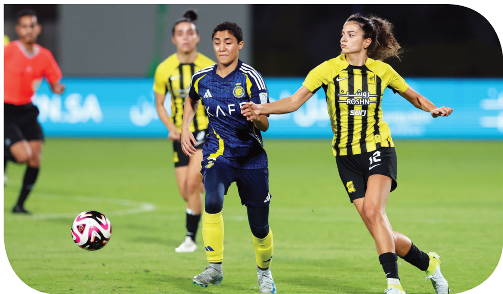
من مباراة سيّدات الاتحاد والنصر