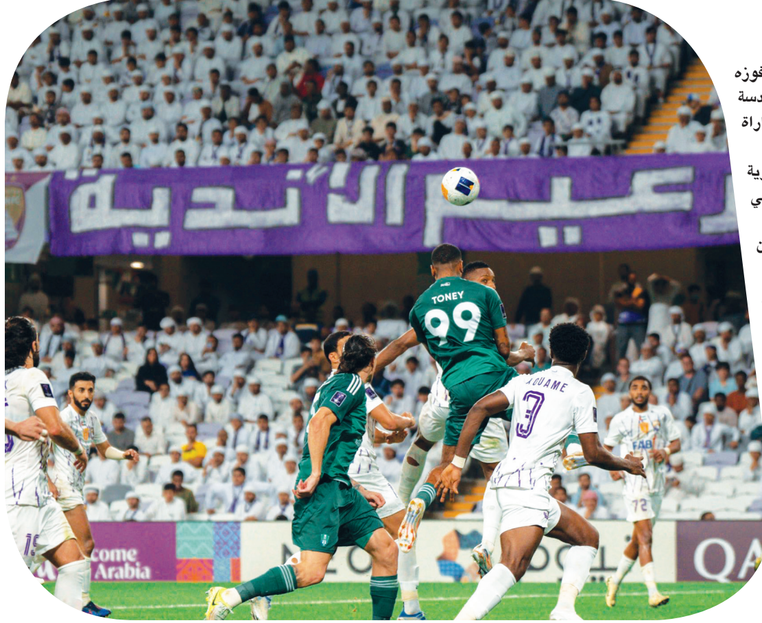
توني يرتقي لكرة رأسية في مباراة الأمس

وانفرد الأهلي مؤقتاً في صدارة ترتيب دوري الغرب برصيد ١٥ نقطة من خمس مباريات، مقابل ١٣ نقطة للنصر، و١٢ من أربع مباريات للهلال، و٨ للنس، و٧ للوصل، و٤ لكل من الاستقلال والغرافة، و٣ لكل من باختاكور والريان، ونقطتين لكل من بيرسيبوليس والشرطة، ونقطة للعين.